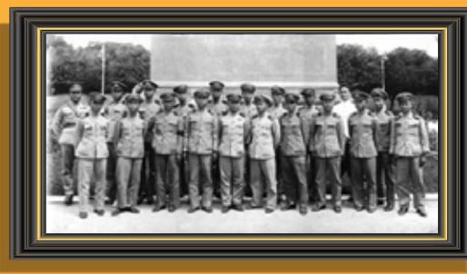
คณะราษฎรสายทหารเรือ