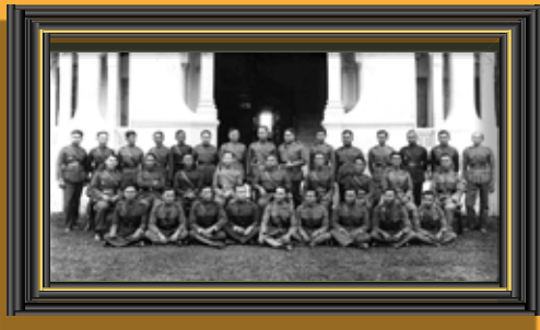
คณะราษฎรสายทหารบก