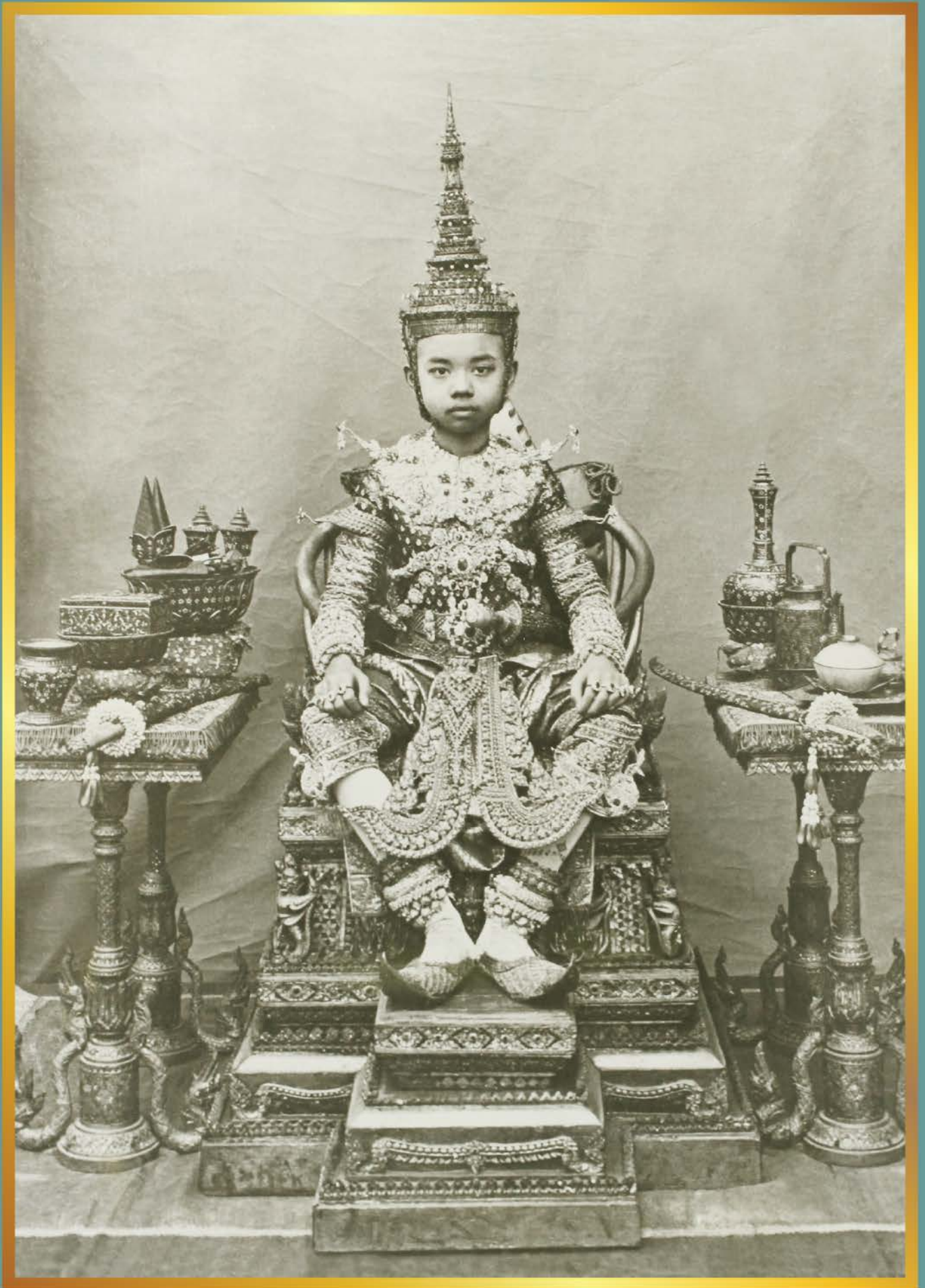
พระบาทสมเด็จพระปกเกล้าเจ้าอยู่หัวในพระราชพิธีโสกันต์ เมื่อปี พ.ศ. 2448