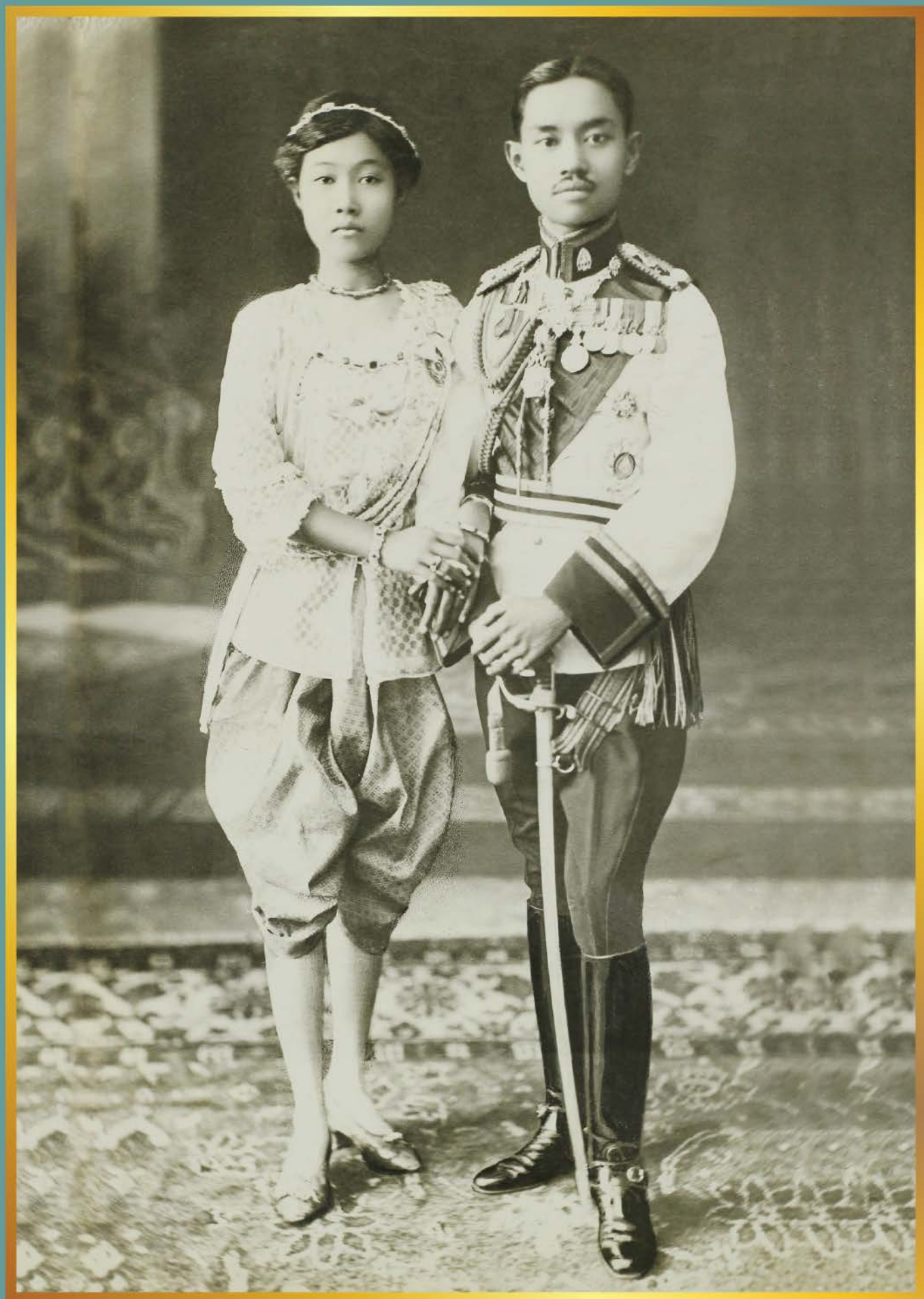
พระบาทสมเด็จพระปกเกล้าเจ้าอยู่หัวและสมเด็จพระนางเจ้ารำไพพรรณี พระบรมราชินี ในวันอภิเษกสมรส วันที่ 26 สิงหาคม 2461