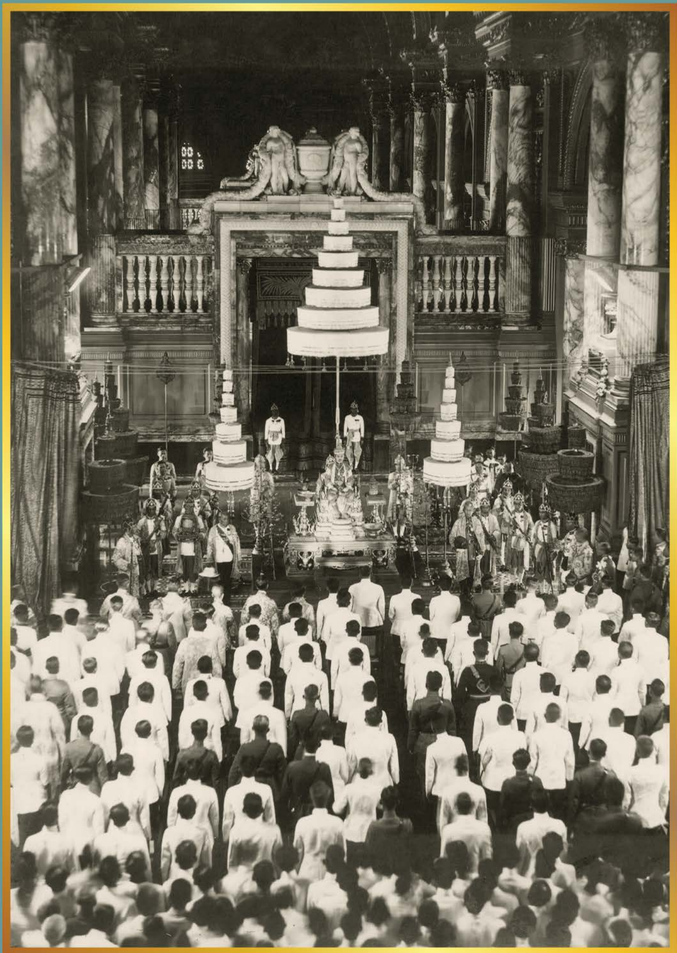
พระบาทสมเด็จพระปกเกล้าเจ้าอยู่หัวทรงเปิดประชุมสภาผู้แทนราษฎร วันที่ 10 ธันวาคม 2476 ณ พระที่นั่งอนันตสมาคม