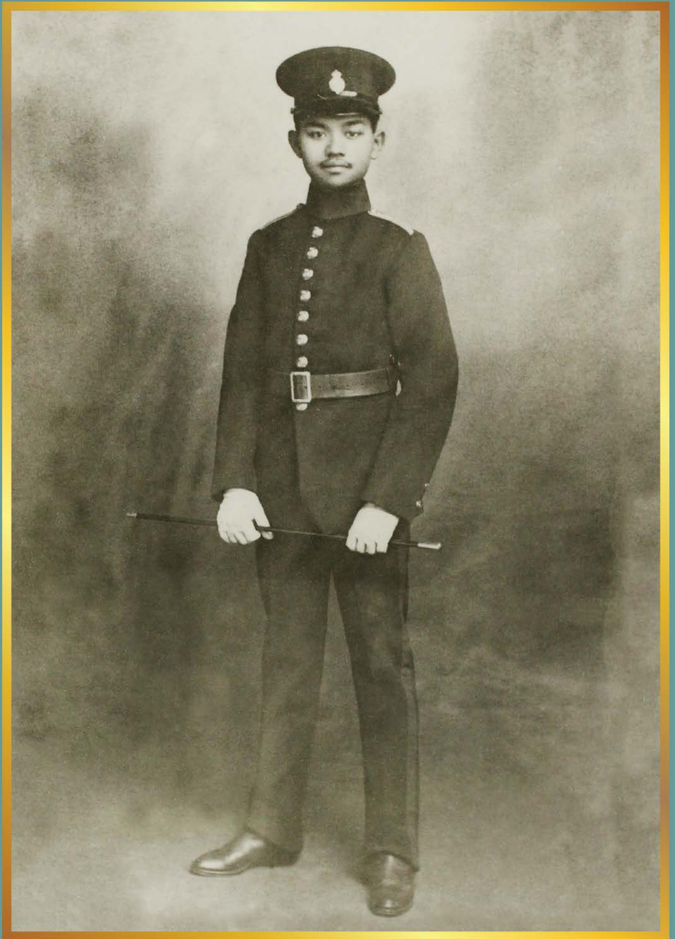
พระบาทสมเด็จพระปกเกล้าเจ้าอยู่หัวทรงเครื่องแบบนักเรียนผู้บังคับบัญชา โรงเรียนนายร้อยทหารเมืองวูลิช (Royal Military Academy, Woolwich)