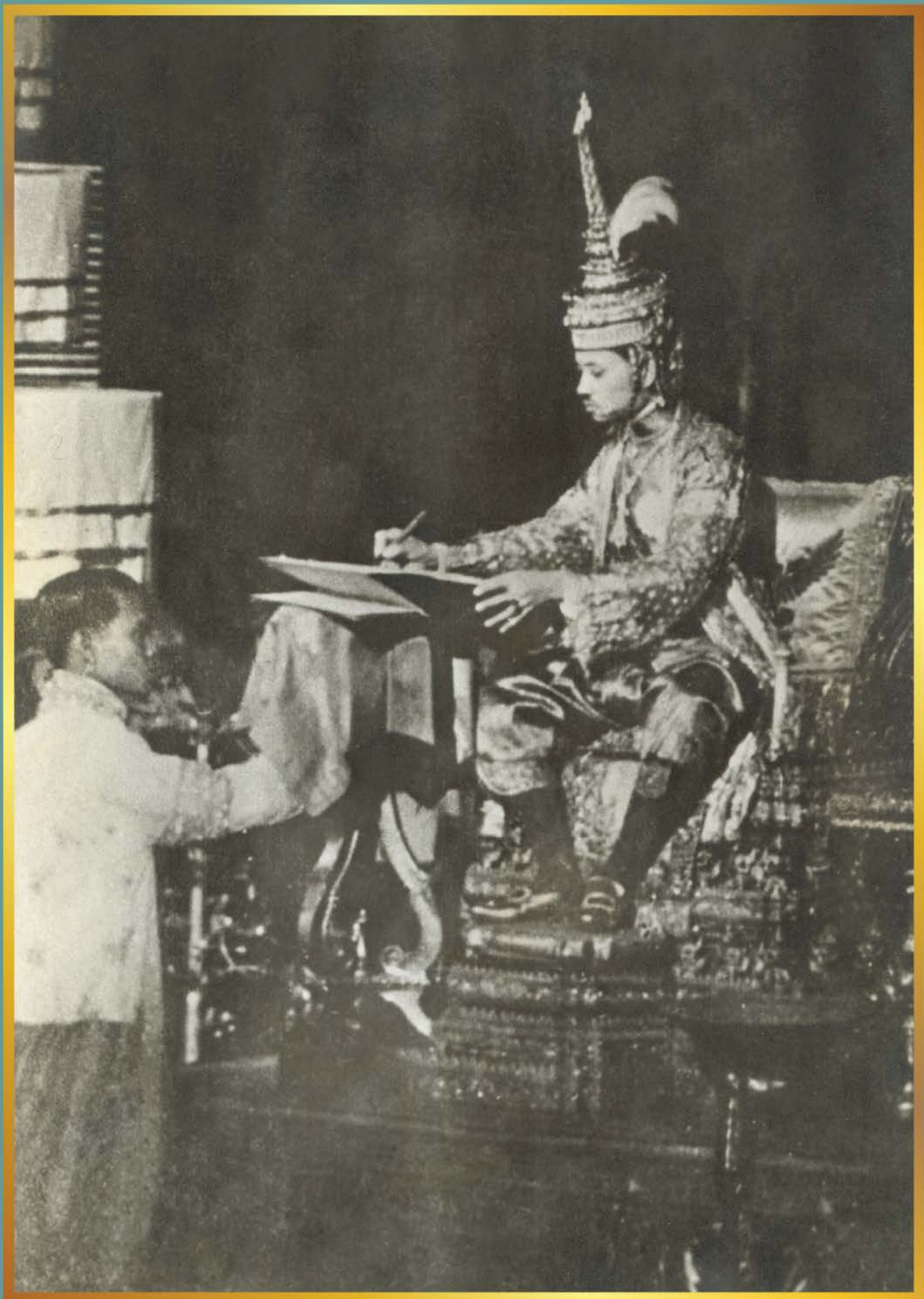
พระบาทสมเด็จพระปกเกล้าเจ้าอยู่หัวทรงลงพระปรมาภิไธยในรัฐธรรมนูญแห่งราชอาณาจักรสยาม พุทธศักราช 2475 วันที่ 10 ธันวาคม 2475 ณ พระที่นั่งอนันตสมาคม