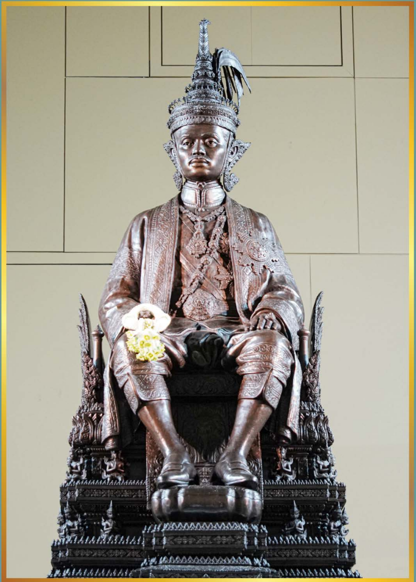
พระบรมราชานุสาวรีย์พระบาทสมเด็จพระปกเกล้าเจ้าอยู่หัว (พระองค์เดิม) ณ พิพิธภัณฑ์รัฐสภา อาคารรัฐสภา ถนนสามเสน