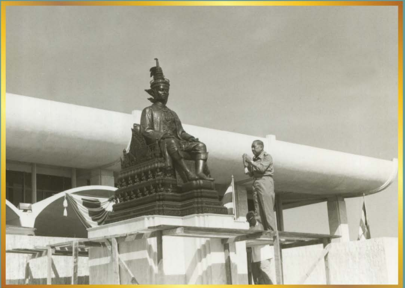
พลอากาศเอก หะริน หงสกุล ประธานสภานิติบัญญัติแห่งชาติ ถวายสักการะพระบรมราชานุสาวรีย์พระบาทสมเด็จพระปกเกล้าเจ้าอยู่หัว ภายหลังการประดิษฐานพระบรมราชานุสาวรีย์ฯ