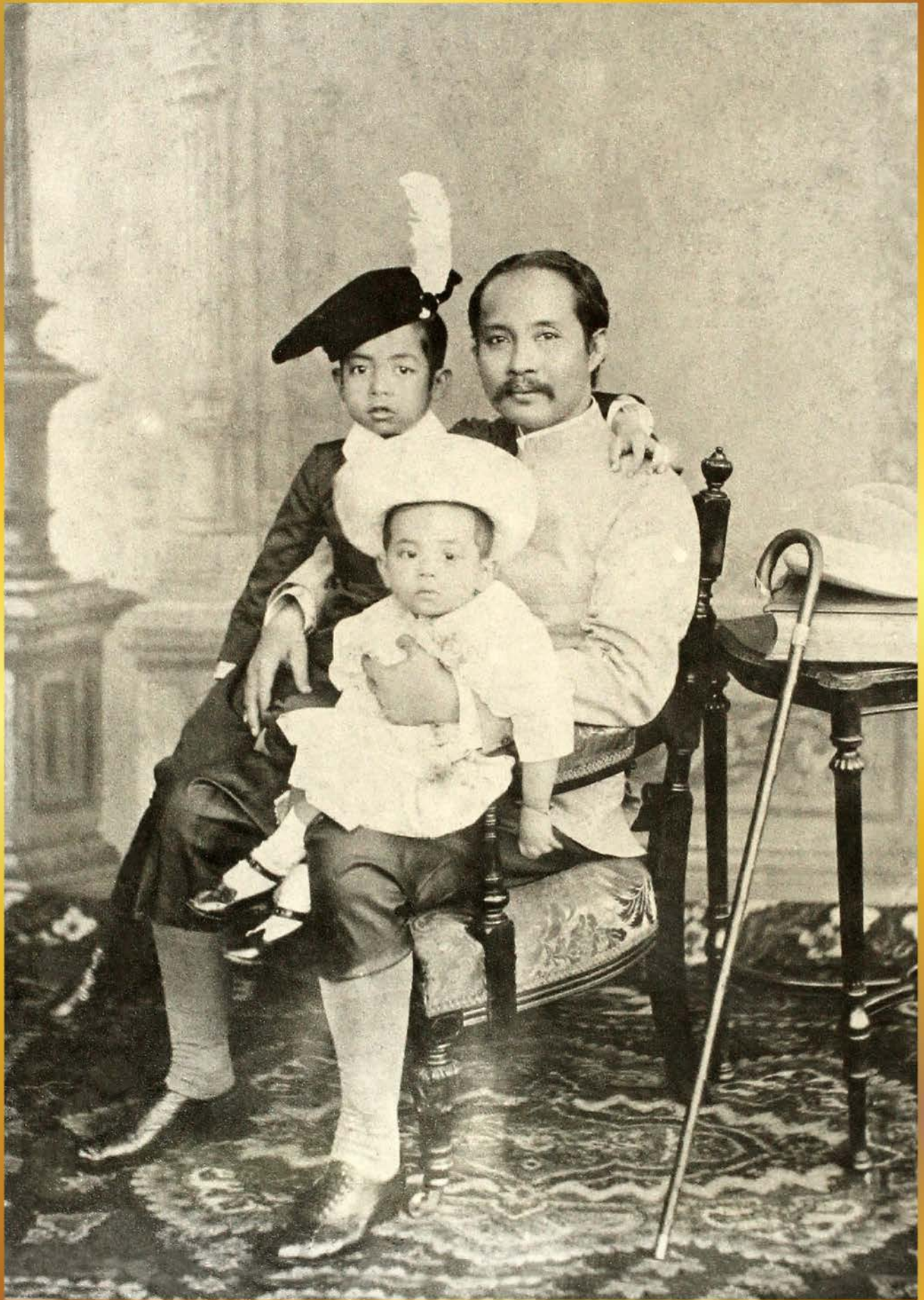
พระบาทสมเด็จพระจุลจอมเกล้าเจ้าอยู่หัวทรงฉายพร้อมพระราชโอรส สมเด็จพระเจ้าฟ้าอัษฎางค์เดชาวุธ กรมหลวงนครราชสีมา และพระบาทสมเด็จพระปกเกล้าเจ้าอยู่หัว (ประทับบนพระเพลา)