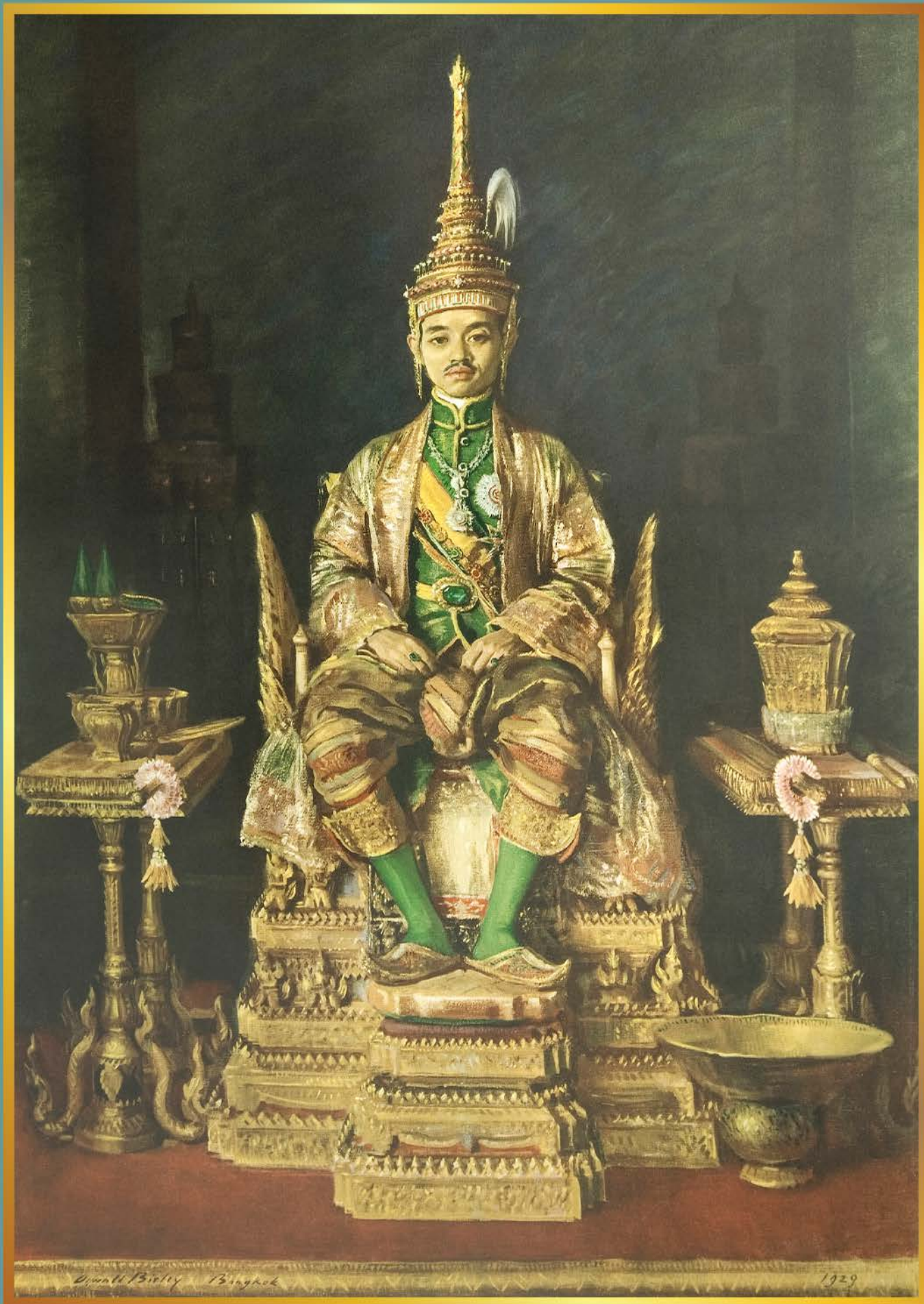
พระบาทสมเด็จพระปกเกล้าเจ้าอยู่หัวประทับเหนือพระที่นั่งพุดตานกาญจจินทาสน์