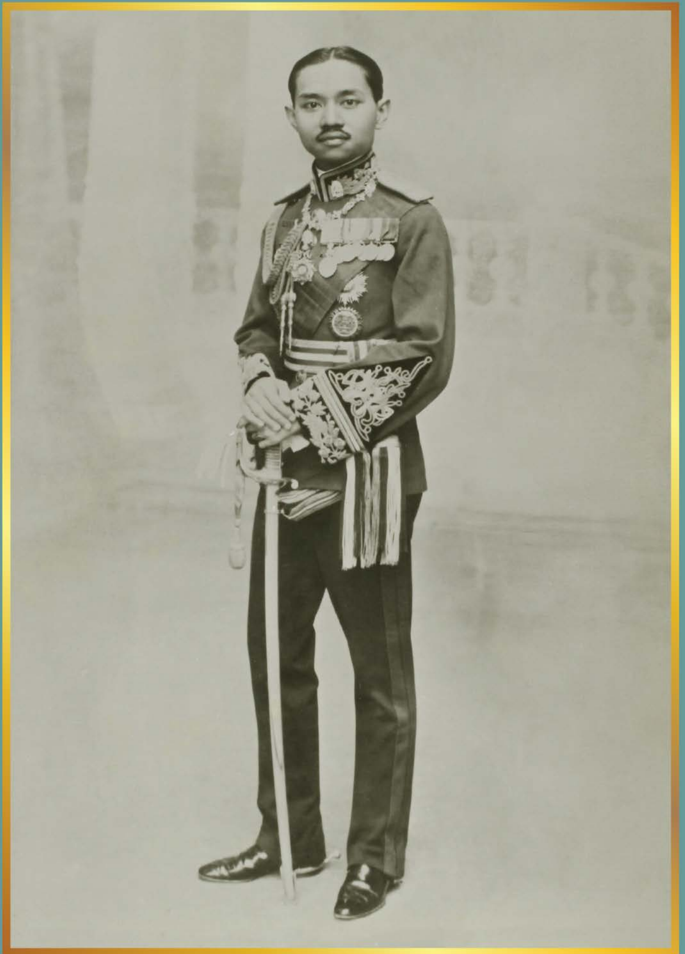
พระบาทสมเด็จพระปกเกล้าเจ้าอยู่หัวทรงฉายขณะได้รับการสถาปนาเป็น สมเด็จพระเจ้าน้องยาเธอ เจ้าฟ้าประชาธิปกศักดิเดชน์ กรมหลวงสุโขทัยธรรมราชา เมื่อปี พ.ศ. 2468