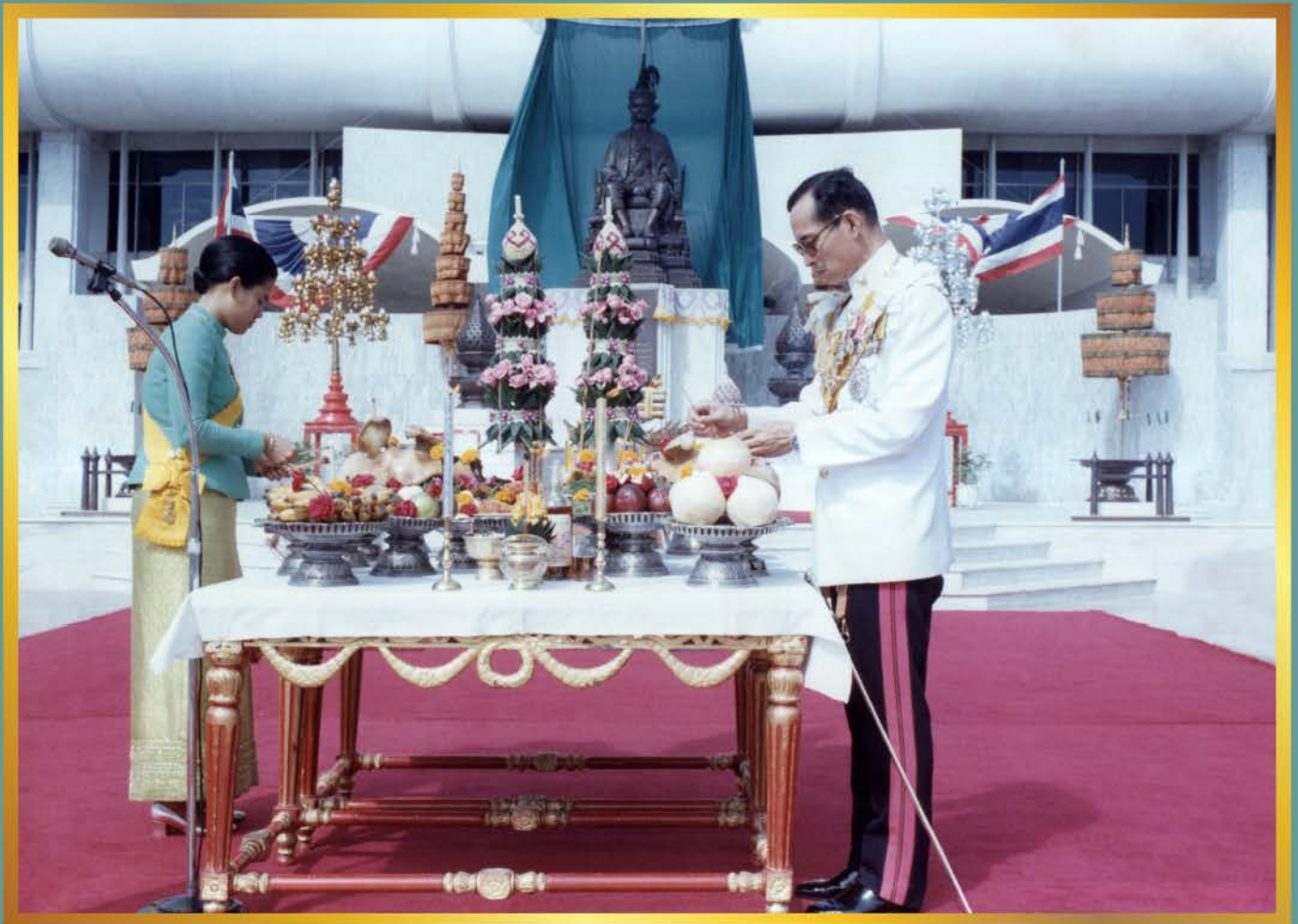
พระบาทสมเด็จพระเจ้าอยู่หัวภูมิพลอดุลยเดชทรงประกอบพระราชพิธี เปิดพระบรมราชานุสาวรีย์พระบาทสมเด็จพระปรมินทรมหาประชาธิปก พระปกเกล้าเจ้าอยู่หัว วันที่ 10 ธันวาคม 2523 ณ อาคารรัฐสภา ถนนอยู่ทองใน