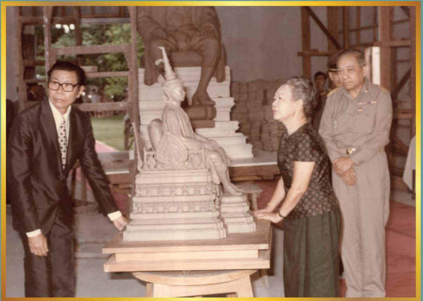
สมเด็จพระนางเจ้ารำไพพรรณี พระบรมราชินี เสด็จพระราชดำเนินไปทอดพระเนตร การขึ้นหุ่นพระบรมราชานุสาวรีย์ วันที่ 10 กรกฎาคม 2521