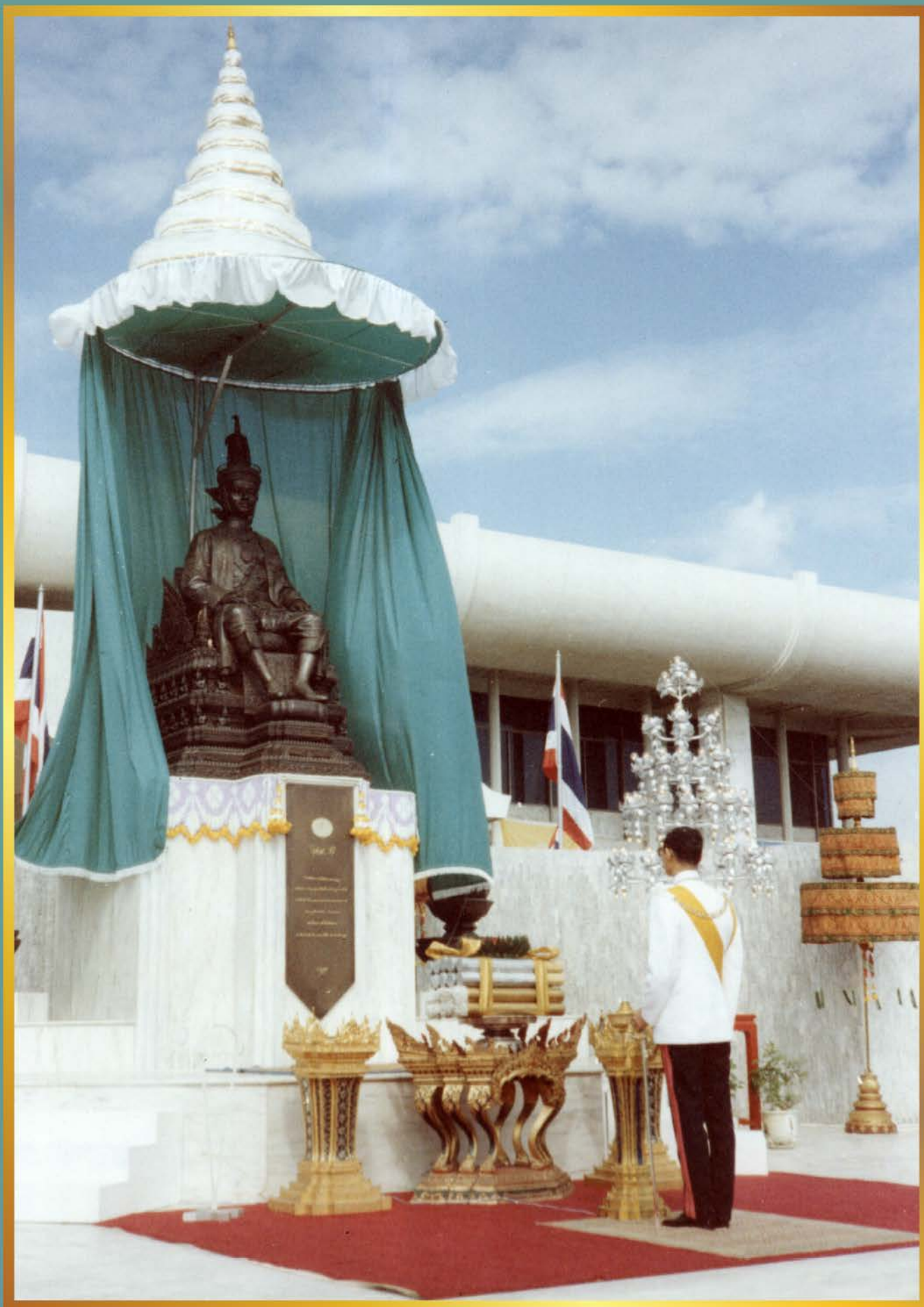
พระบาทสมเด็จพระเจ้าอยู่หัวภูมิพลอดุลยเดชทรงประกอบพระราชพิธีเปิดพระบรมราชานุสาวรีย์ พระบาทสมเด็จพระปรมินทรมหาประชาธิปก พระปกเกล้าเจ้าอยู่หัว วันที่ 10 ธันวาคม 2523