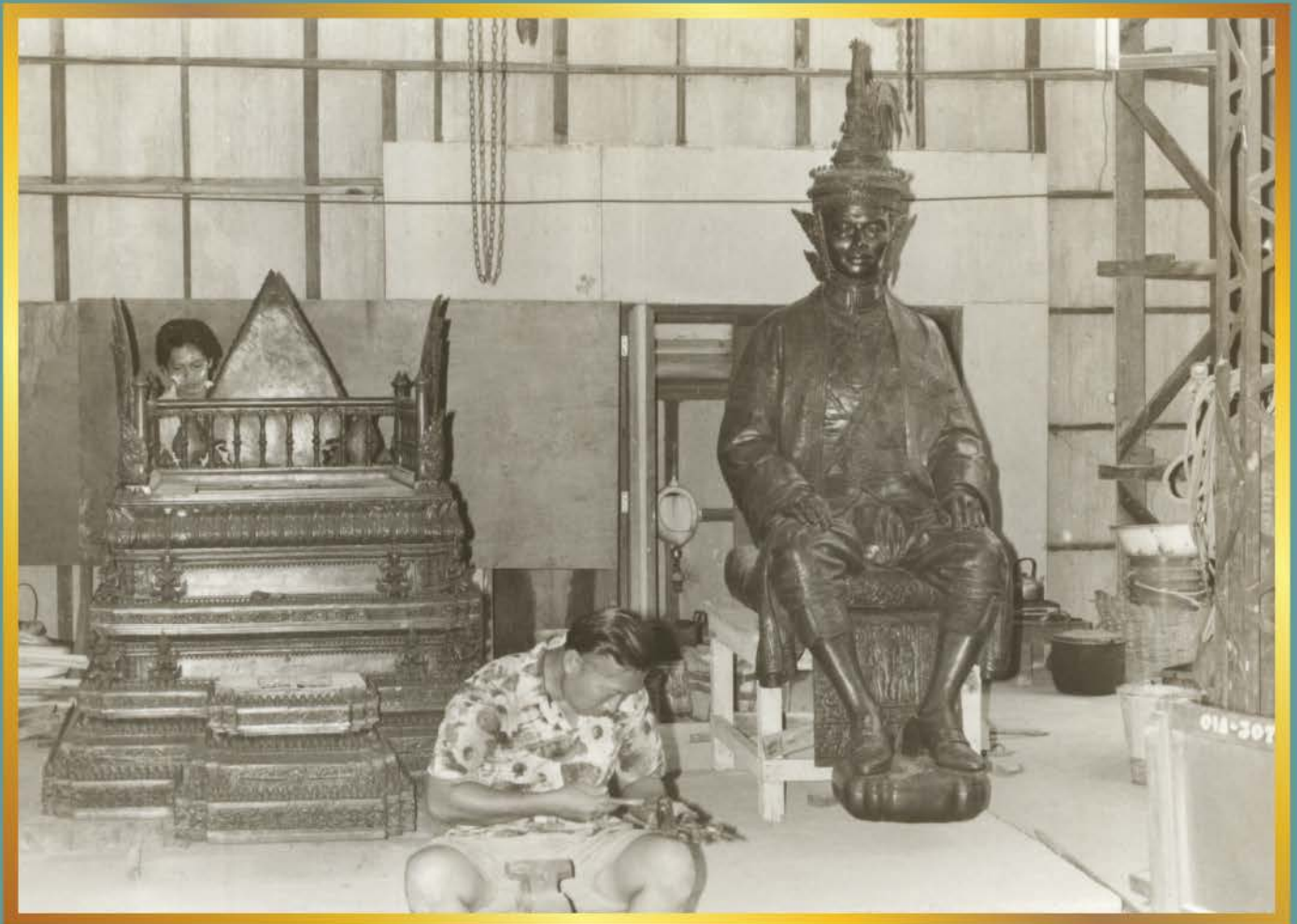
การดำเนินการปั้นพระบรมรูปพระบาทสมเด็จพระปกเกล้าเจ้าอยู่หัว ในโรงงานปั้นหล่อชั่วคราว บริเวณรัฐสภา ถนนอุทองโน